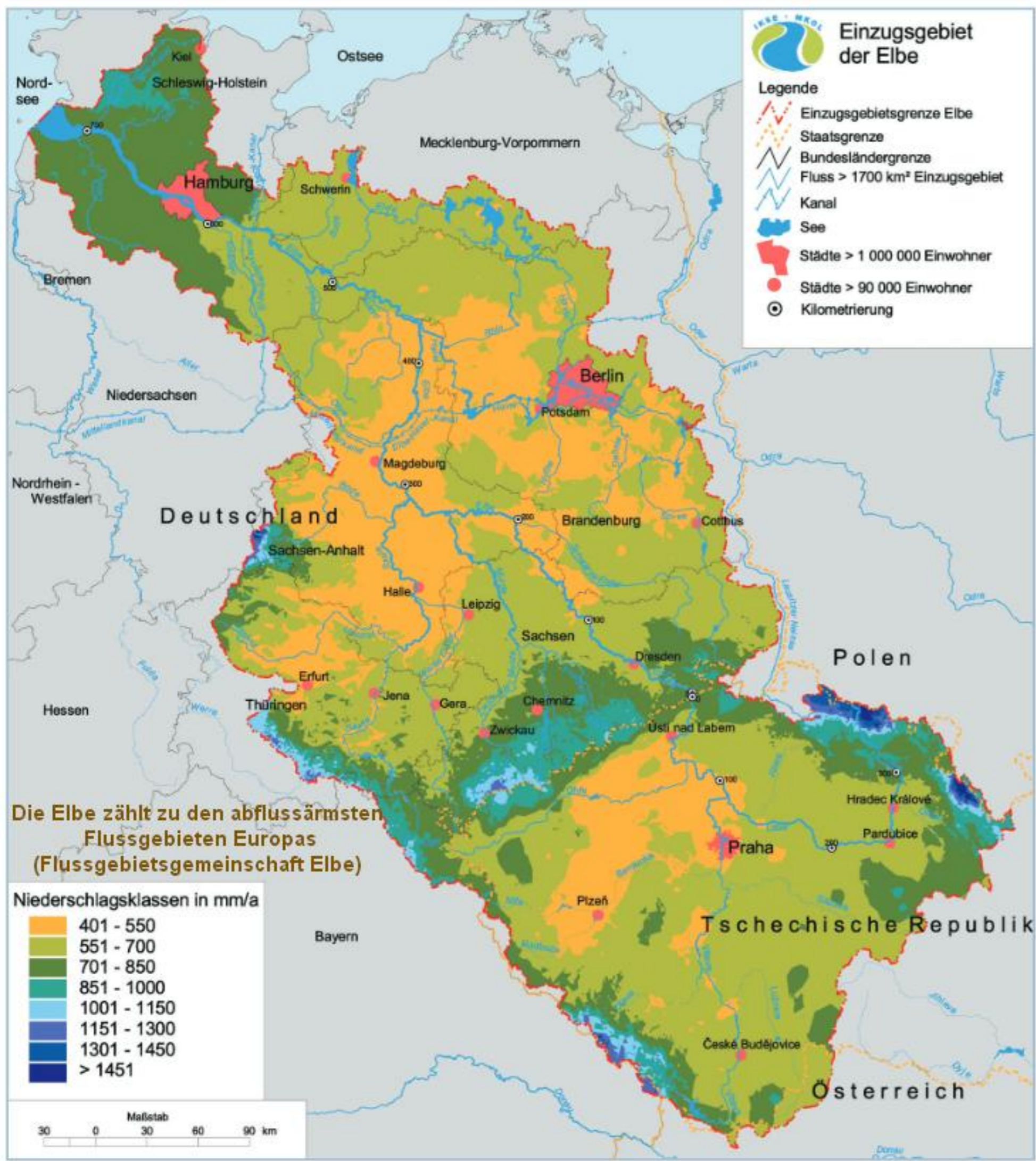
Abb. 2.3-1: Mittlere jährliche Niederschlagshöhen im Einzugsgebiet der Elbe (Jahresreihe 1961 – 1990)

Bei dieser Ansage im Fernsehen erwartet man eine Deutschlandkarte, auf der der atmosphärische Zustand der nächsten Tage angezeigt wird: Lufttemperatur, Bewölkung, Niederschlag, Wind. Uns Landbewohnern ist das selbstverständlich, aber das versteht doch kein Fisch! Dieser Beitrag von »Rettet die Elbe« handelt deshalb vom Wasserwetter, und langfristig vom Wasserklima.